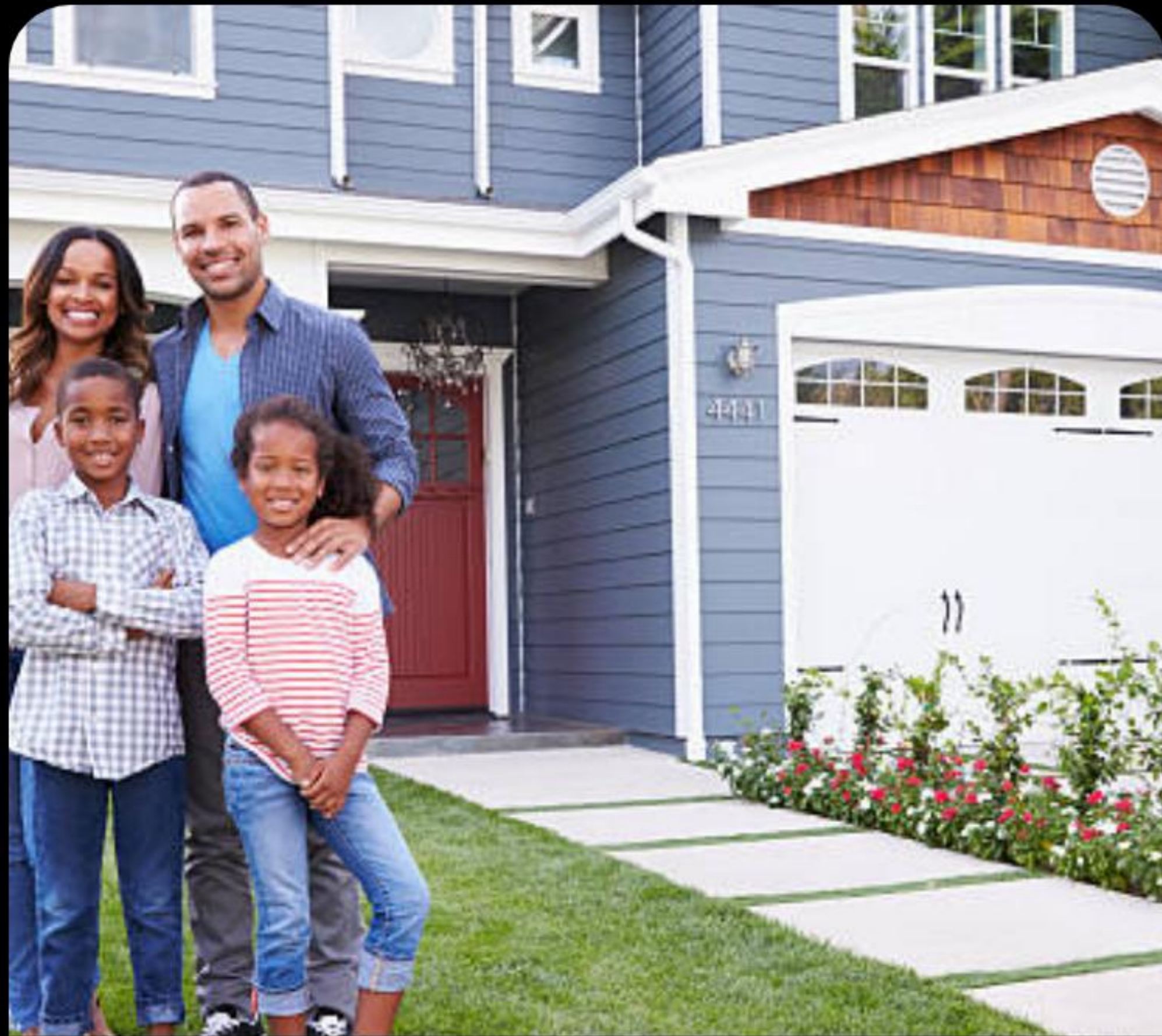
Familias Multigeneracionales: Aprovechando ingresos combinados.