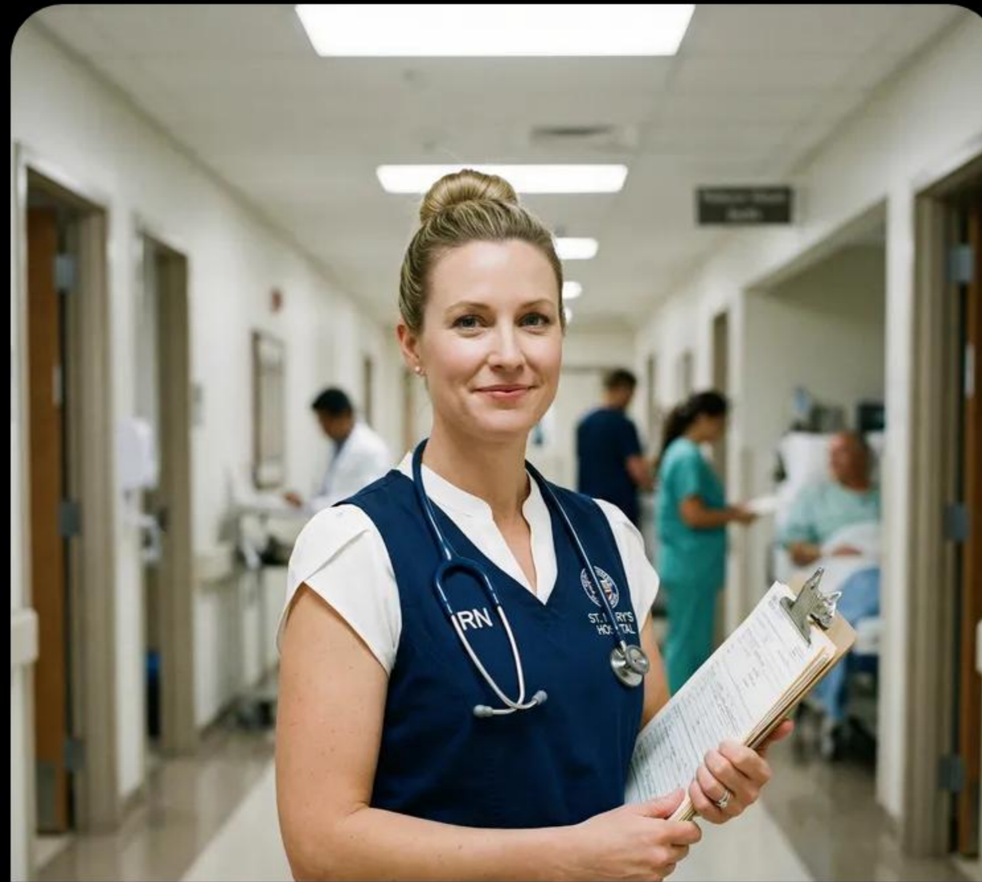
Personal de Salud: Acceso a créditos "Hometown Heroes".