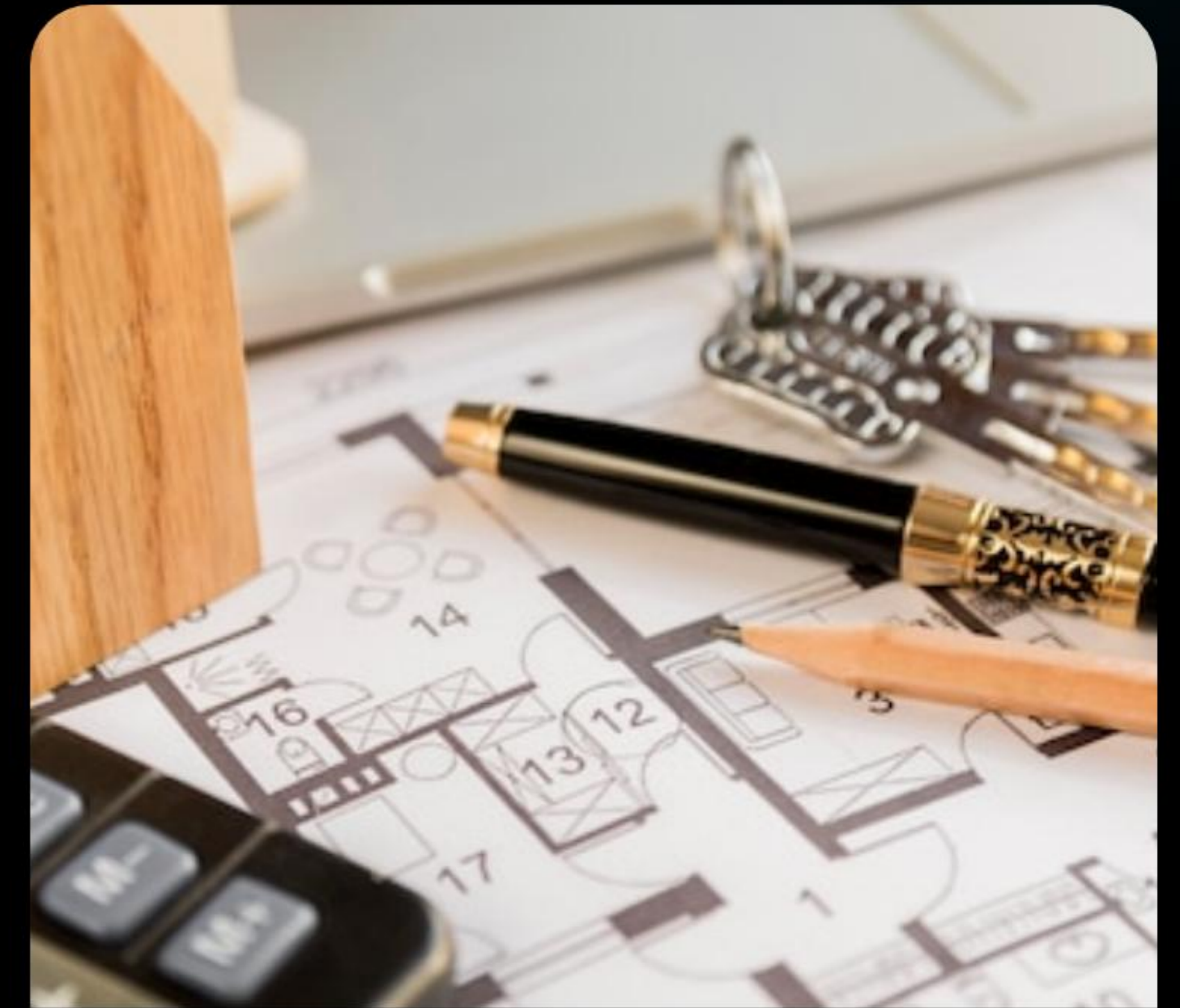
Nuevos Residentes: Guía para primeros compradores en 2026.